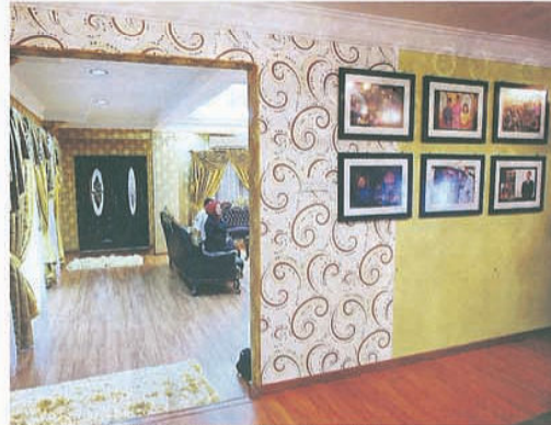
Ruang dinding tidak dibiarkan kosong dihiasi dengan hiasan potret keluarga.