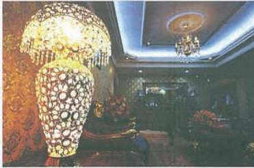
Lampu meja yang mewah cepat menangkap pandangan mata.

makan, Pak Engku masih dengan konsep mewahnya dengan menggunakan set meja makan English Royal Style yang disaluti warna keemasan. "Ruangan dapur dan meja makan adalah antara tempat penting bagi saya. Sebagai chef, saya sentiasa memastikan tempat santapan menjadi ruang keutamaan, sudah tentunya selesa dan eksklusif," katanya. Kemasannya mengikut konsep dekorasi menjadi titik fokus apabila disuai padan dengan perabot atau aksesori hiasan lain. Langsir yang digunakan di keseluruhan ruangan rumah Pak Engku juga antara pekej yang turut disediakan oleh Empire Classic Furniture selain lampu hiasan dan candelier. "Kesesuaian dari perhiasan perabot seperti sofa, set meja makan, almari sehingga langsir, lampu candelier dan cermin hiasan mudah didapati di Empire Classic Furniture. "Dengan harga yang berpatutan malah lebih rendah dari harga perabot mewah di pasaran. Namun begitu setiap perabot yang dijual mempunyai kualiti yang setanding dengan jenama mewah lain. Bak kata pepatah, biarlah membeli tapi menag memakai," ujarnya.