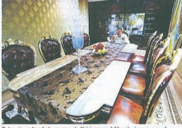
Set meja makan batu marmar kulit ini menyerlahkan lagi gaya mewah.